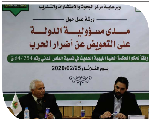
وبرعاية مركز البحوث والاستشارات والتدريب

نظمت كلية القانون بجامعة بنغازي الأهلية، وبرعاية مركز البحوث والتدريب والاستشارات بالجامعة، يوم الثلاثاء الماضي ورشة عمل حول (مدى مسؤولية الدولة علي التعويض عن أضرار الحرب) وفقاً لحكم المحكمة العليا الليبية الحديث في قضية الطعن المدني رقم 64/ 254 ق، وذلك في إطار هدف ورؤية الجامعة لتوفير